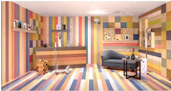
木質建材ブランド「KITOIRO」 https://kitoiro.com (2018年11月20日公開予定)