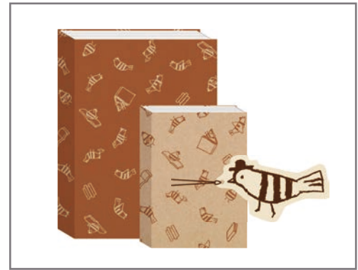
本のある暮らしを楽しむ雑貨