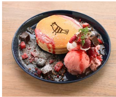
『しろくまちゃんのほっとけーき』(こぐま社)からイメージした新メニュー