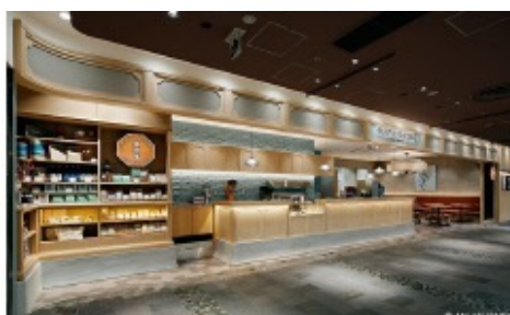
猿田彦珈琲 恵比寿アトレ店