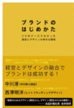
ブランドのはじめかた (日経 BP 社/共著)

1976年滋賀県生まれ。株式会社エイトブランディングデザイン代表。「ブランディングデザインで日本を元気にする」というコンセプトのもと、企業のブランド開発、商品開発、店舗開発など幅広いジャンルでのデザイン活動を行っている。「フォーカスRPCD®」という独自のデザイン開発手法により、リサーチからプランニング、コンセプト開発まで含めた、一貫性のあるブランディングデザインを数多く手がける。主な仕事にクラフトビール「COEDO」、ヤマサ醤油「まる生ぼん酢」、料理道具店「釜浅商店」、iPhoneアルバムスキャナ「Omoidori」、博多「警固神社」など。グッドデザイン賞をはじめ、国内外の受賞多数。著書に『ブランドをデザインする！』（パイ インターナショナル）など。