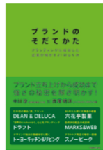
ブランドのそだてかた (日経 BP 社/共著)