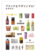
ブランドをデザインする！ (パイ インターナショナル)