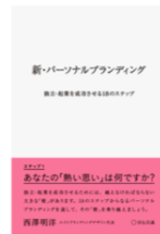
新・パーソナルブランディング (宣伝会議)